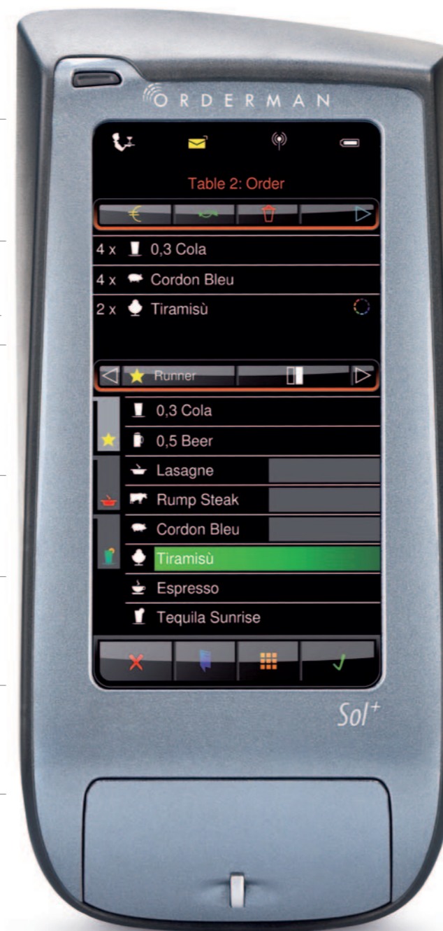
Imagen: Imagen a tamaño real

Interfaz Bluetooth integrada para la conexión de la impresora de cinturón*